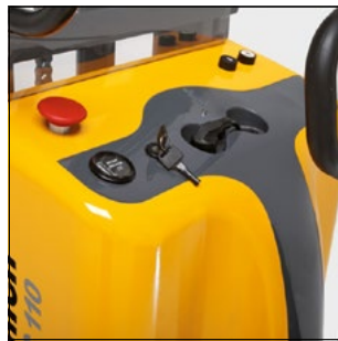
Übersichtliche Anordnung aller Bedien- und Anzeigeelemente