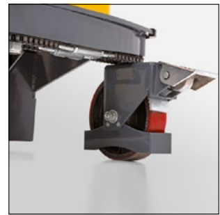
Lenkrad mit Feststellbremse