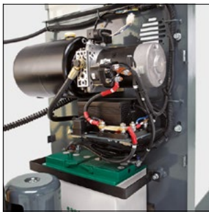
Gute Zugänglichkeit zu allen Komponenten