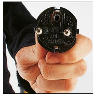
Einfach an die 230 V Steckdose